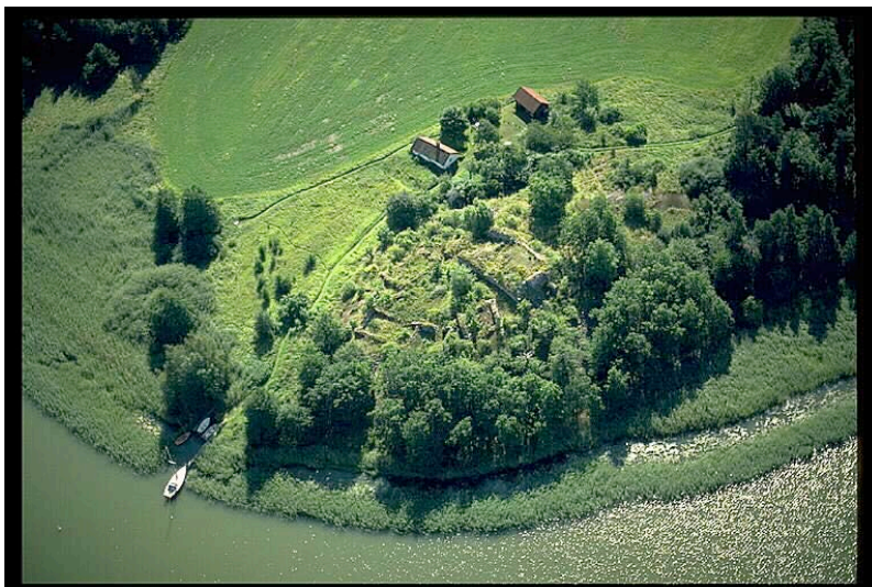
Skällviks Borg