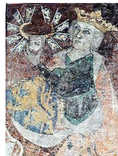
Kung Birger, Ringstede kyrka

Kung Birger av Sverige kungör att han godkänner och stadfäster det jordabyte, som ägt rum mellan hans far kung Magnus och kyrkan i Uppsala, varvid kung Magnus fått 13 1/2 öresland jord och 2 1/2 penningland på Valmundsön, 12 öresland i Ekeby samt hela den tomt i Stockholm, där spetälskehospitalet förr låg, med undantag av kyrkogården, medan nämnda kyrka i utbyte fått 22 markland i "Wingru" i byn Norby, 1/2 markland i Husby-Bro, fisket under bron i Uppsala och hälften av ån där sammastädes åt öster till en längd av 650 fot, såsom finns skildrat i kung Magnus' brev rörande detta (av 12860522, DS 913); denna stadfästelse utfärdar han, trots att den f.d. marsken Torkel försökt