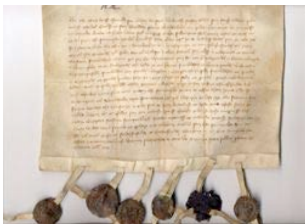
Dokument utfärdat i Söderköping 15 maj 1376 (Detta har inget med Skällvik eller Stegeborg att göra, men är en bra bild på ett dokument i original)