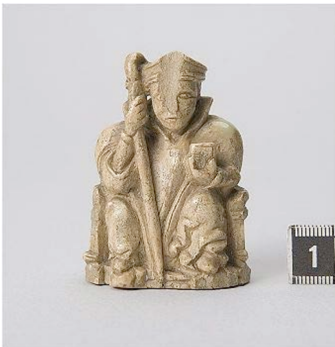
Schackpjäs av ben från Stegeborgs slott. 10

Själva arbetet vid Skällvik leddes dock i praktiken ej av Ekhoff och av bevarad korrespondens, som redovisas på annan plats på hemsidan, är till och med tveksamt huruvida Ekhoff ens besökte Skällvik.